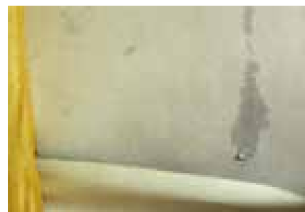
Poškození stěn v interiéru po vniknutí vody